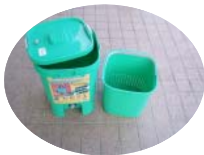
家庭用生ごみ発酵処理器 キッチンサイクラー