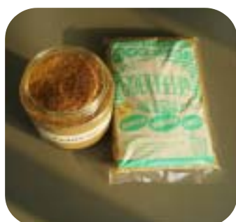
生ごみ発酵促進剤 マイクロエコロジー