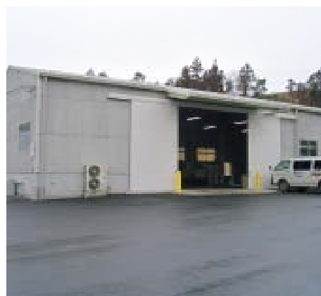
工場の一部：生ごみの発酵処理場