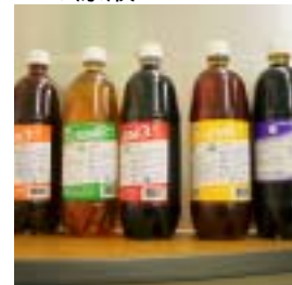
EMの原液 EM 1・2・3・4号