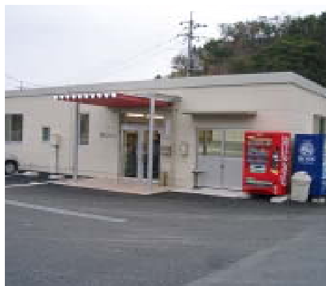
バイオ事業部事務所