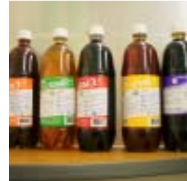
EMの原液 EM 1・2・3・4号