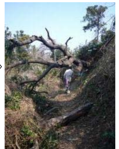
チェーンソーを使い、倒木を除去