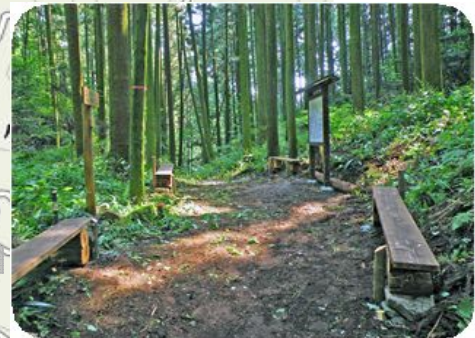
⑨ 松尾峠(駕籠立場跡、茶屋跡)