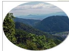
⑪ 展望台(岩国城見える)