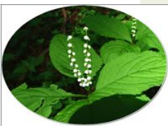
⑩ フタリスズカ群生