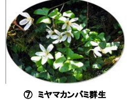
⑦ ミヤマカンパニ群生