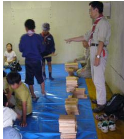
あらかじめパーツ毎にカットされた材料、釘、金槌、キリを受け取ります。