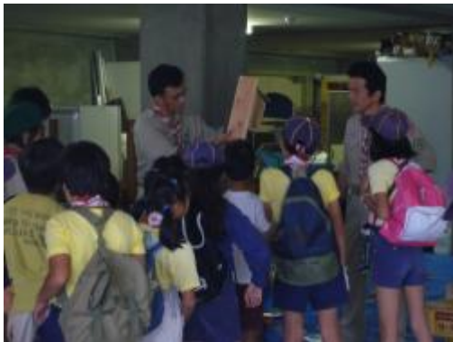
完成見本を見せながら説明をします