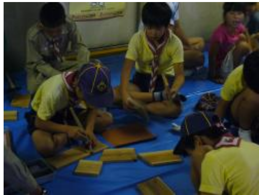
キリで釘を打つ場所に穴をあけます