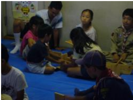
どんな風に組み合わせるか研究中